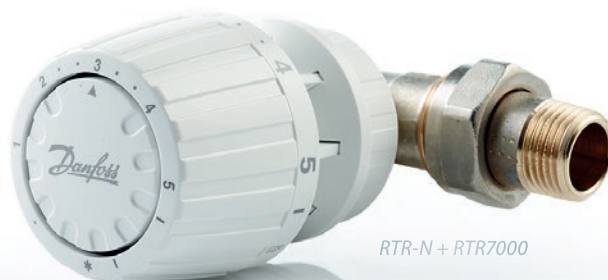
RTR-N + RTR7000

Для того чтобы обеспечить дополнительный комфорт для жильцов, радиаторные клапаны должны быть оснащены терморегулирующим элементом. Это позволяет регулировать температуру в каждой комнате отдельно. Компания Danfoss предлагает широкий выбор радиаторных элементов для тех, кому необходим максимальный контроль, а также превосходное качество и дизайн.